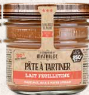
PATES0002 PÂTE À TARTINER LAIT NOISSETTE FEUILLETINE 250G