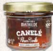
CANNE0003 CANELÉ AU RHUM VANILLE 4,8% VOL. 100G