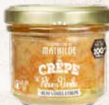
CREPE0004 CRÊPES RHUM VANILLE 4,8% VOL. 100G