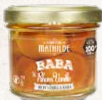
BABAS0019 BABA AU RHUM SAVEUR VANILLE 12% VOL. 100G