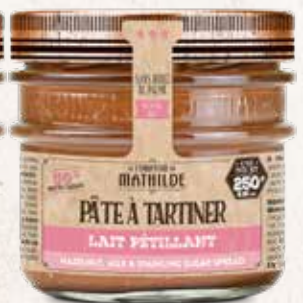
PATES0004 PÂTE À TARTINER LAIT NOISSETTE PÉTILLANT 250G