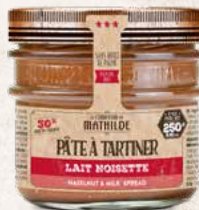
PATES0001 PÂTE À TARTINER LAIT NOISSETTE 250G