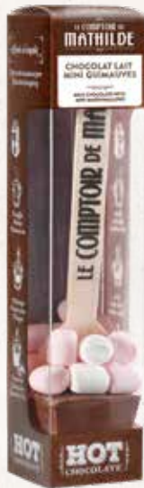
HOTCH0015 HOT CHOCOLATE CHOCOLAT LAIT MINI GUIMAUVES 30G