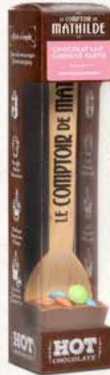
HOTCH0010 HOT CHOCOLATE CHOCOLAT LAIT SURPRISE PARTIE 30G