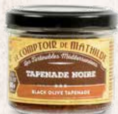
TARTI0002 TAPENADE NOIRE 90G