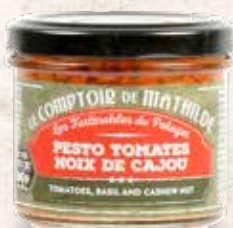
TARTI0024 PESTO TOMATES NOIX DE CAJOU 90G