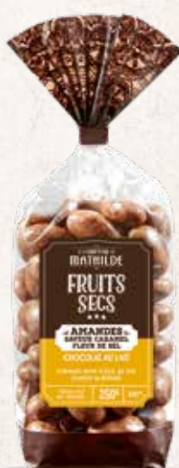
TURBI0012 AMANDES SAVEUR CARAMEL FLEUR DE SEL SACHET 250G