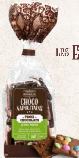
NAPOS0001 NAPOLITAINS ASSORTIMENT 3 CHOCOLATS SACHET DE 150G