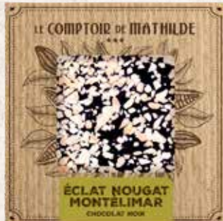
TABPM0010 TABLETTE CHOCOLAT NOIR ÉCLAT DE NOUGAT 80G