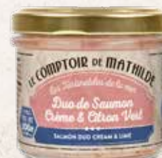
TARTI0020 DUO DE SAUMON CRÈME & CITRON VERT 100G