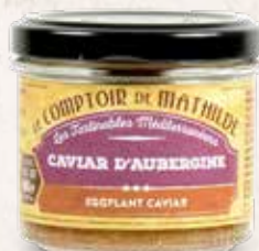
TARTI0009 CAVIAR D'AUBERGINE 90G