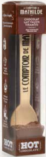
HOTCH0013 HOT CHOCOLATE CHOCOLAT LAIT FAÇON TIRAMISU 30G