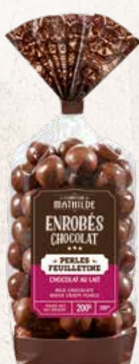
TURBI0017 PERLES FEUILLETINE CHOCOLAT AU LAIT SACHET 200G