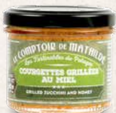
TARTI0025 COURGETTES GRILLÉES AU MIEL 90G