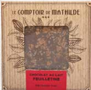
TABPM0023 TABLETTE CHOCOLAT LAIT FEUILLETINE 80G