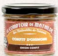
TARTI0019 CONFIT D'OIGNONS 90G