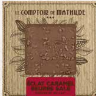
TABPM0020 TABLETTE CHOCOLAT LAIT ÉCLAT DE CARAMEL AU BEURRE SALÉ 80G