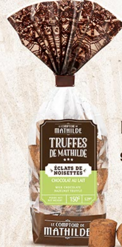
TRUFF0003 TRUFFE CHOCOLAT AU LAIT AUX ÉCLATS DE NOISETTES 150G