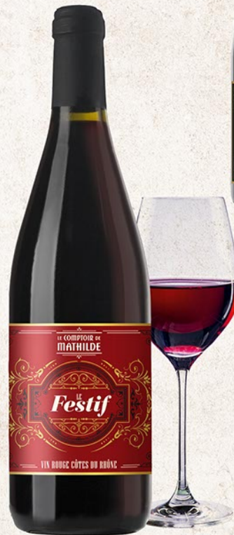
ALCOLO087 «LE FESTIF» VIN ROUGE 13,5% 75CL CÔTES DU RHÔNE AOC