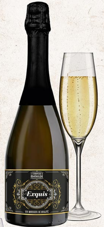
ALCOLO091 «L'EXQUIS» VIN MOUSSEUX DE QUALITÉ 13% VOL.75CL