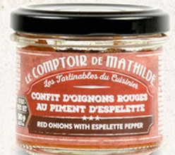
TARTIO015 CONFIT D'OIGNONS ROUGES AU PIMENT D'ESPELETTE 90G