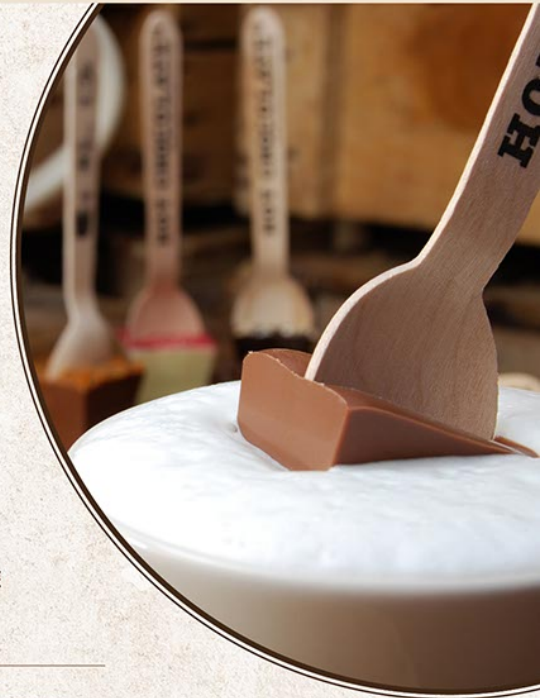
HOTCH0002 HOT CHOCOLATE CHOCOLAT NOIR 30G