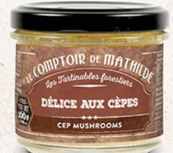
TARTIO043 DÉLICE AUX CÈPES 100G