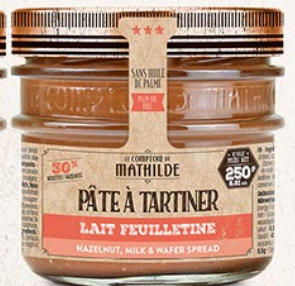
PATES0002 PÂTE À TARTINER LAIT NOISETTE FEUILLETINE 250G