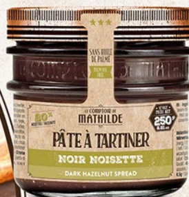
PATES0010 PÂTE À TARTINER NOIR NOISETTE 250G