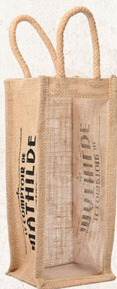
ASACS0005 CONTENANT JUTE BOUTEILLE