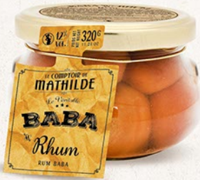
BABAS0001 BABA AU RHUM 12% VOL. 320G