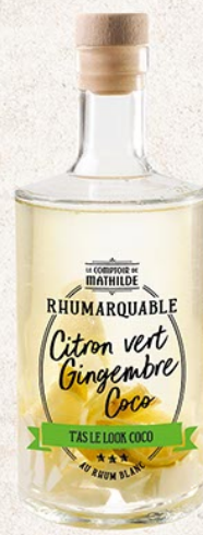
ALCOLO098 RHUM ARRANGÉS PASSION, GINGEMBRE, ORANGE 30% 70CL