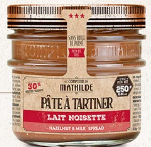
PATES0001 PÂTE À TARTINER LAIT NOISETTE 250G

4,50€ TTC L'UNITÉ 3,75€ HT L'UNITÉ (4,27€ HT POUR LA TABPM0003)