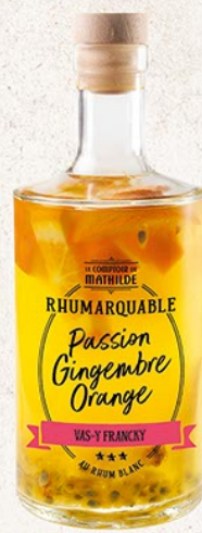
ALCOLO099 RHUM ARRANGÉS CITRON VERT, GINGEMBRE, COCO 30% 70CL