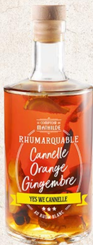
ALCOLO089 RHUM ARRANGÉS ANANAS, VANILLE 30% 70CL