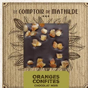
TABPM0003 TABLETTE NOIR ORANGES CONFITES 80G