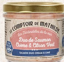
TARTIO020 DUO DE SAUMON CRÈME & CITRON VERT 100G