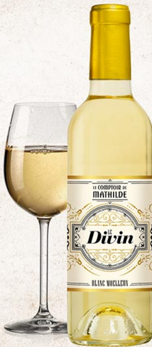
ALCOLO077 «LE DIVIN» VIN BLANC 11,5% 37,5CL MOELLEUX CÔTES DE BERGERAC