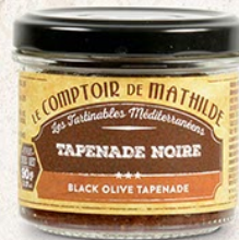
TARTIO002 TAPENADE NOIRE 90G