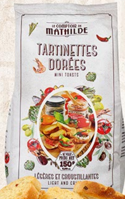
CROUS0001 TARTINETTES DORÉES 150G