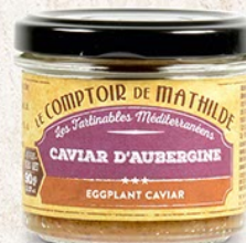
TARTIO009 CAVIAR D'AUBERGINE 90G