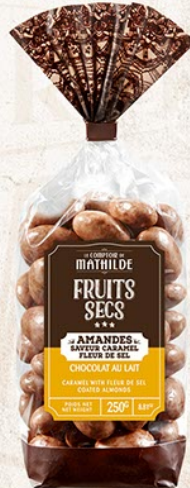
TURBIO012 AMANDES SAVEUR CARAMEL FLEUR DE SEL SACHET 250G