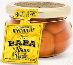
BABAS0016 BABA AU RHUM SAVEUR VANILLE 12% VOL. 320G