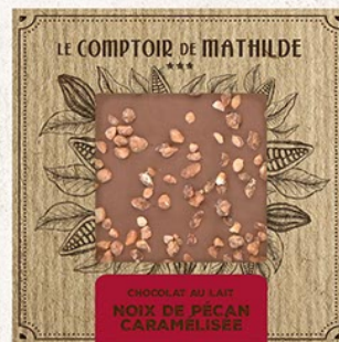
TABPM0022 TABLETTE CHOCOLAT LAIT NOIX DE PÉCAN CARAMELISÉES 80G