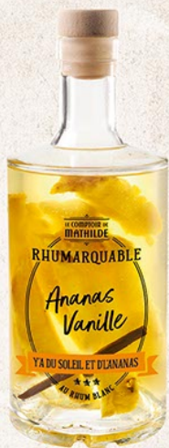
ALCOLO096 RHUM ARRANGÉS CANNELLE, ORANGE, GINGEMBRE 30% 70CL