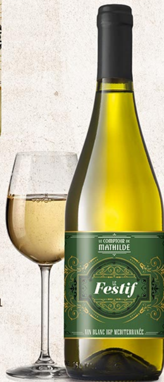
ALCOLO103 «LE FESTIF» VIN BLANC 12,5% 75CL IGP MÉDITERRANÉE