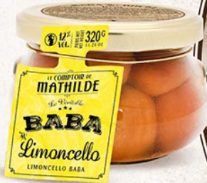
BABAS0008 BABA AU LIMONCELLO 12% VOL. 320G