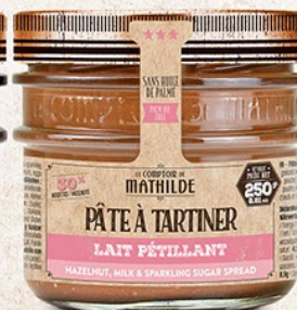
PATES0004 PÂTE À TARTINER LAIT NOISETTE PÉTILLANT 250G