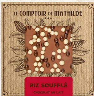
TABPM0019 TABLETTE CHOCOLAT LAIT PERLES CRISPY 80G