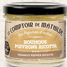
TARTIO031 HOUMOUS POIVRONS RICOTTA 90G