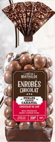
TURBIO010 PERLES SAVEUR CARAMEL CHOCOLAT AU LAIT SACHET 200G