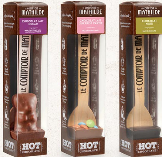
HOTCH0014 HOT CHOCOLATE CHOCOLAT LAIT OSCAR 30G