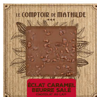
TABPM0020 TABLETTE LAIT ÉCLATS CARAMEL BEURRE SALÉ 80G