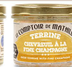
APER0016 TERRINE CHEVREUIL À LA FINE CHAMPAGNE 90G