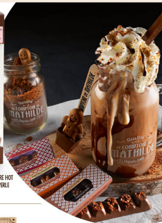
HOTCH0011 CUILLÈRE HOT CHOCOLATE LAIT PERLE CRISPY 30G