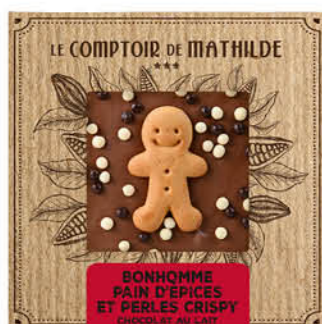
TABPM0047 TABLETTE LAIT BONHOMME PAIN D'ÉPICES ET PERLES CRISPY 80G