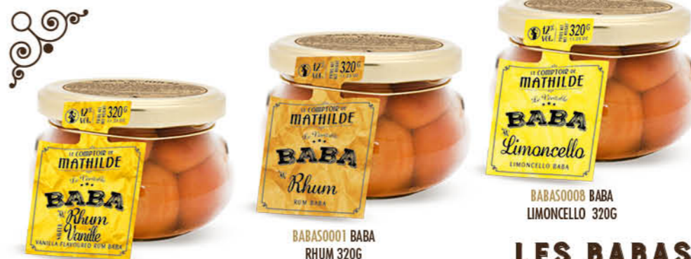
BABAS0016 BABA RHUM VANILLE 320G