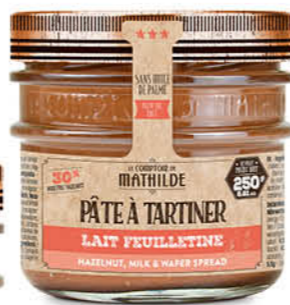
PATES0002 PÂTE À TARTINER LAIT NOISETTE FEUILLETINE 250G