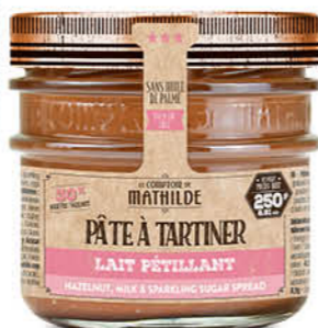
PATES0004 PÂTE À TARTINER LAIT NOISETTE PÉTILLANT 250G