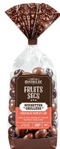
TURBI0015 NOISETTES GRILLÉES CHOCOLAT NOIR ET LAIT 200G