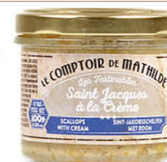
TART10021 SAINT JACQUES À LA CRÈME 100G