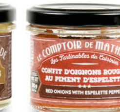
TART10015 CONFIT D'OIGNONS ROUGES AU PIMENT D'ESPELETTE 90G