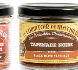
TART10002 TAPENADE NOIRE 90G