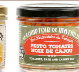
TART10024 PESTO TOMATES NOIX DE CAJOU 90G