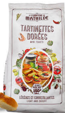
CROUS0001 TARTINETTES DORÉES 150G