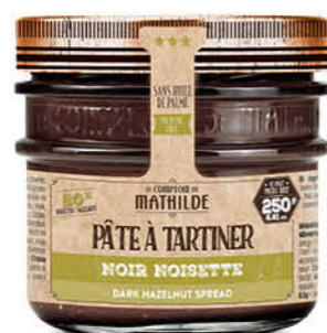
PATES0010 PÂTE À TARTINER NOIR NOISETTE 250G