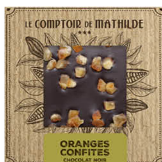
TABPM0003 TABLETTE NOIR ORANGES CONFITÉS 80G