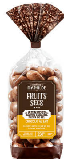
TURBI0012 AMANDES SAVEUR CARAMEL FLEUR DE SEL CHOCOLAT AU LAIT 250G