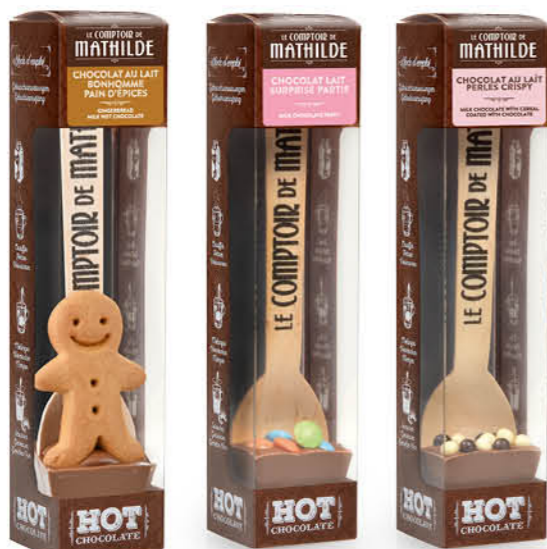
HOTCH0058 CUILLÈRE HOT CHOCOLATE LAIT BONHOMME PAIN D'ÉPICES 30G