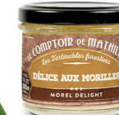
TART10038 DÉLICES AUX MORILLES 100G