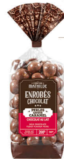
TURBI0010 PERLES SAVEUR CARAMEL CHOCOLAT AU LAIT 200G