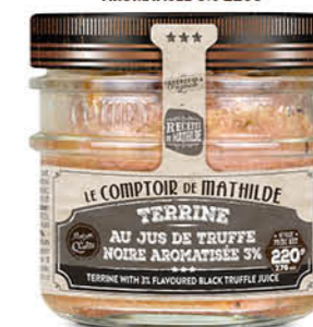
APER0008 TERRINE JUS DE TRUFFE NOIRE AROMATISÉE 3% 220G